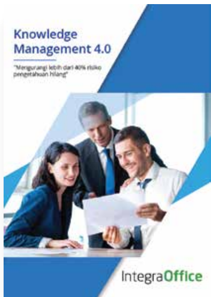
Knowledge Management System 4.0