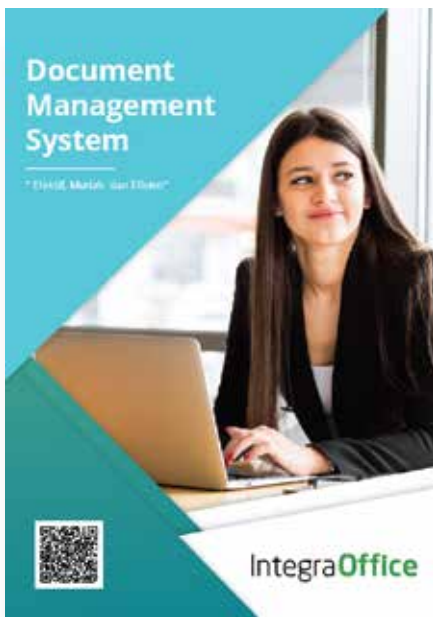
Document Management System